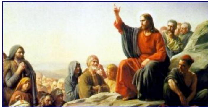
"La Sermo a la Montania" par Bloch.